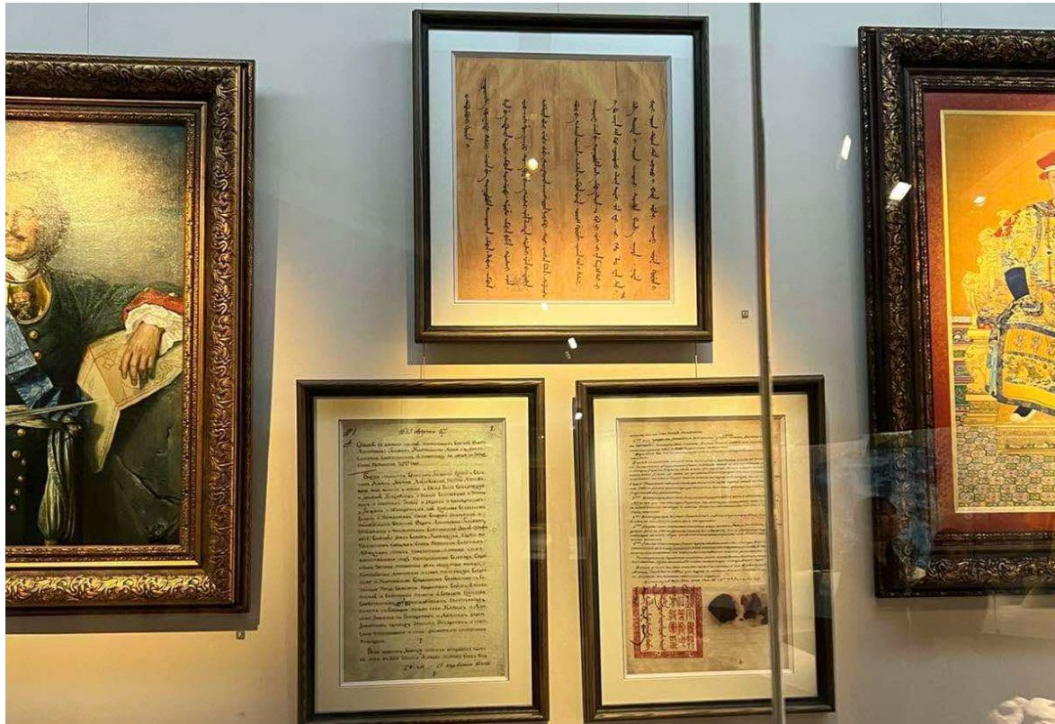
Долоодугаар давхар. Үзмэр: Түшээт хааны алтан шүншигтэй тамга