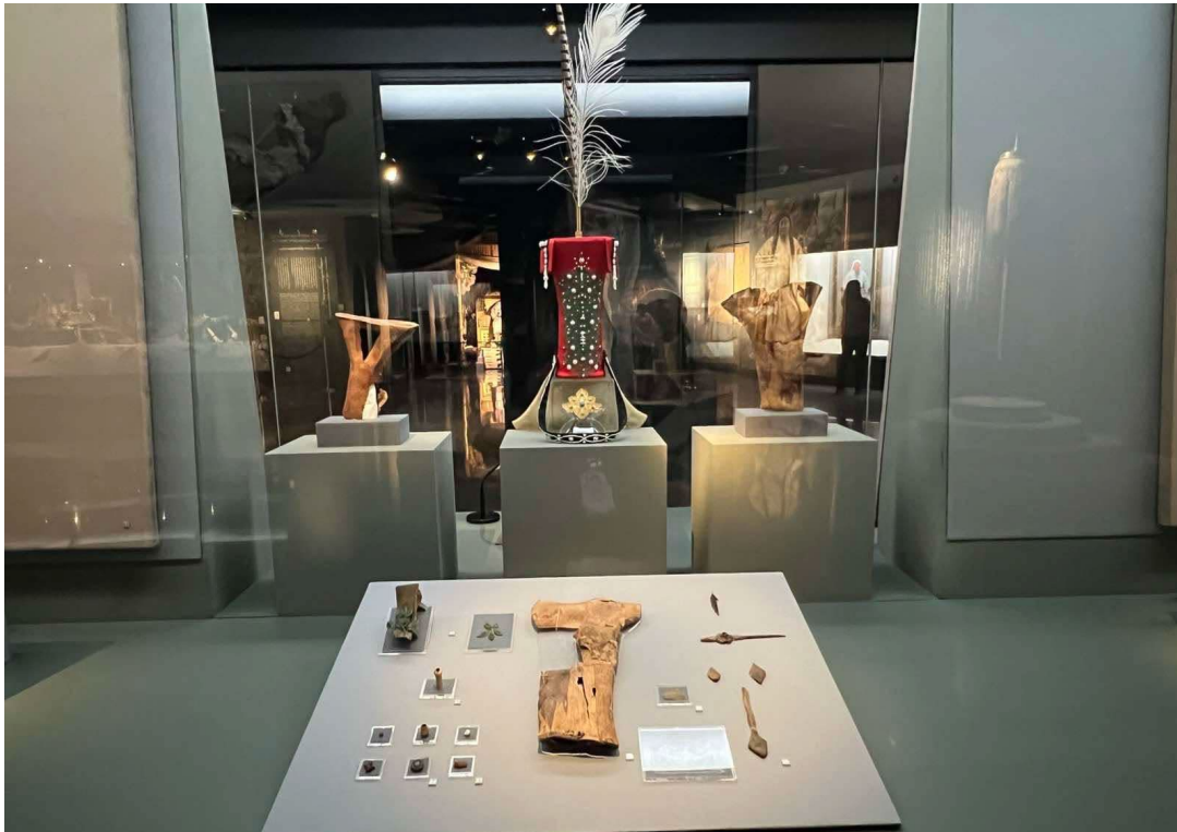
Долоодугаар давхар. Чингис хааны угсааны хаад, язгууртны танхим Долоодугаар давхар. Үзмэр: Халхын Абтай сайн хаан (Хуулбар зураг)